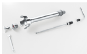
Asta e coltello smontabile