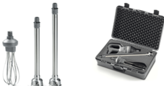
Aste e frusta