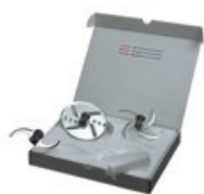
Kit per il fresco