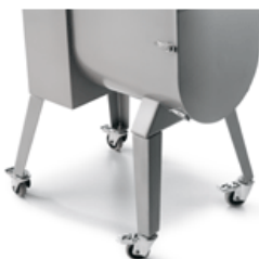
Gambe con ruote opzionali