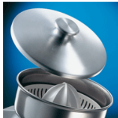
Coperchio - opzionale