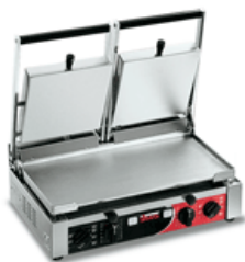
PD XX Timer