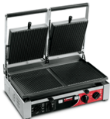
PD R Timer