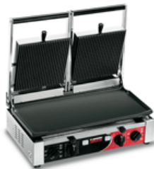
PD L Timer