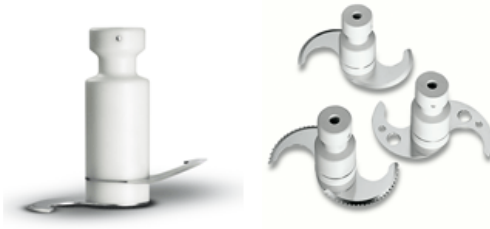
Lama per impasti