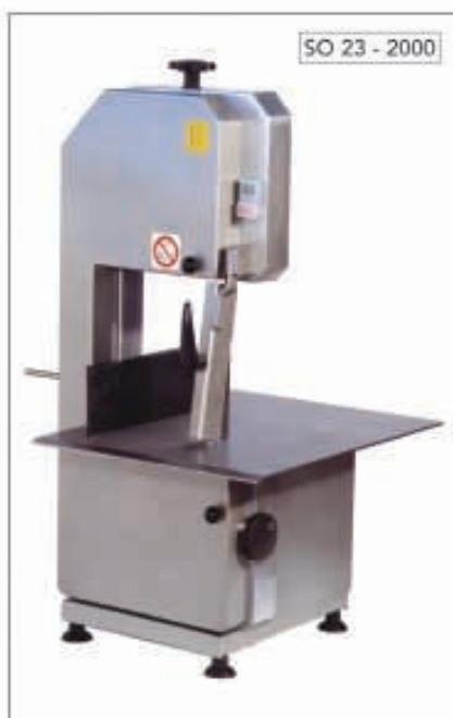
SO 23 - 2000

Segaassi di linea moderna, stabili, facili nella pulizia e nella manutenzione. Pomolo di tensionamento del nastro, pulegge smontabili, comandi a bassa tensione. Motore autoventilato con frenatura elettronica. Utilizzando gli appositi cavalletti è possibile una installazione a pavimento.